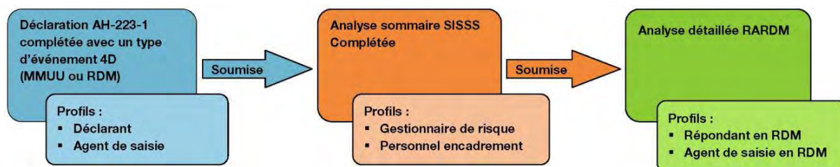
Figure 1 Cheminement d'une déclaration

Il est à noter que les RARDM complétés en format papier (dans les établissements ou la saisie est centralisée) doivent être retranscrits dans le formulaire électronique.