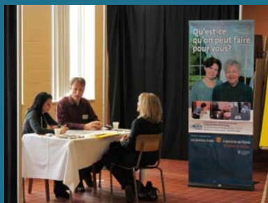
Speed-dating de l'emploi (CJE Memphrémagog)